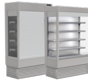
refrigerado com estore de segurança elétrico ou manual refrigerated with electric or manual security shutters