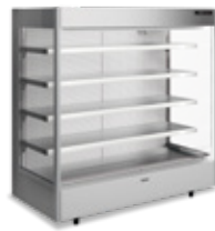
refrigerado sem base refrigerated without base