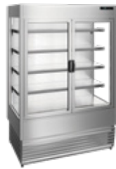
refrigerado com portas frontais (opcionais) refrigerated with front doors (optional)