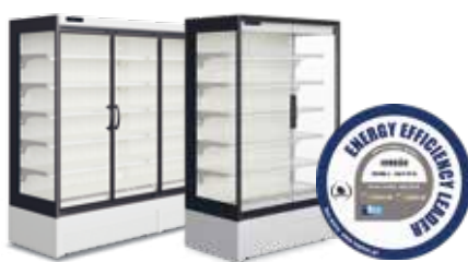
Alimentos refrigerados Chilled foods Portas convencionais / Portas Full Vision Conventional glass doors / Full Vision glass doors