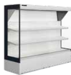
Frutas & Legumes Fresh Produce