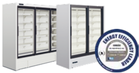
Alimentos congelados Frozen foods Portas convencionais / Portas Full Vision Conventional glass doors / Full Vision glass doors